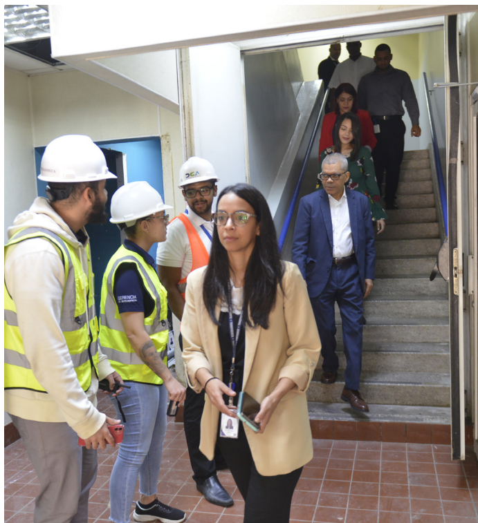
Parte de los colaboradores de la DGA bajando, de forma organizada, ante el llamado de los brigadistas.

El simulacro fue realizado en la sede central de la DGA en horas de la mañana y recibió el apoyo total de los supervisores que orientaron de manera rápida a los colaboradores bajo su dependencia. Igual como se había pedido cuando sonaron las alarmas todos estuvieron atentos y se colocaron en una fila para salir del edificio de manera organizada. En todo momento siguieron las ordenes de los brigadistas y fueron hasta el punto de encuentro indicado. El simulacro fue organizado por la Gerencia de Recursos Humanos