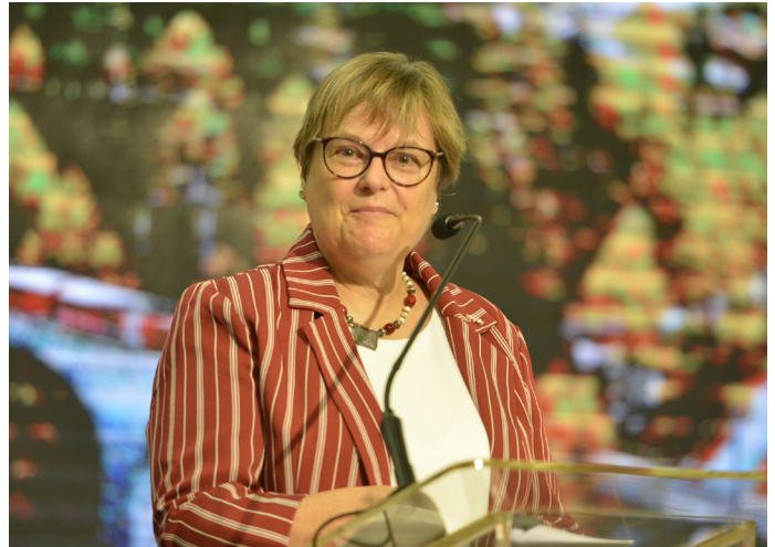
Embajadora de Suiza en la República Dominicana, Rita Hämmerli-Weschke.

“En materia de facilitación del comercio hemos logrado la institucionalización del Comité Nacional de Facilitación del Comercio a través de la Ley 168-21. Este comité es la principal herramienta institucional como mesa permanente de diálogo para los temas de facilitación del