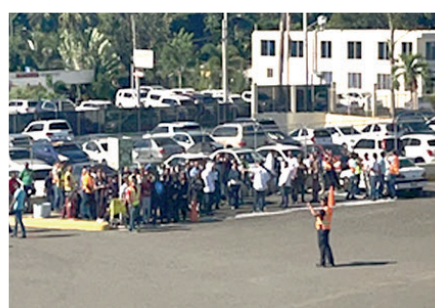
Aeropuerto del Cibao