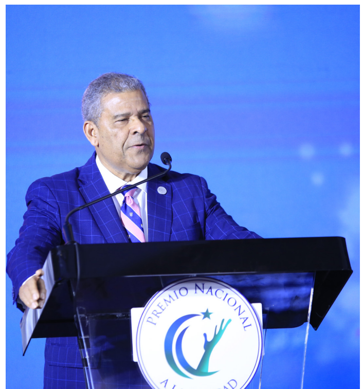
El ministro de Administración Pública, Darío Castillo Lugo.

El titular del Ministerio de Administración