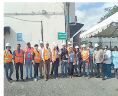
Administración Santo Dgo