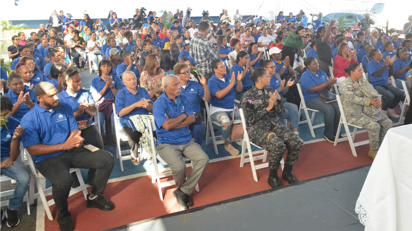
Los asistentes, al inicio del programa “Vivir sin violencia, es Posible”, que desde ya, está en marcha.