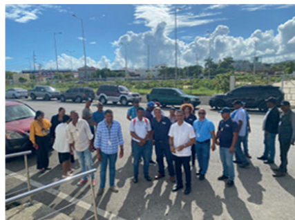
Muelle Puerto Plata