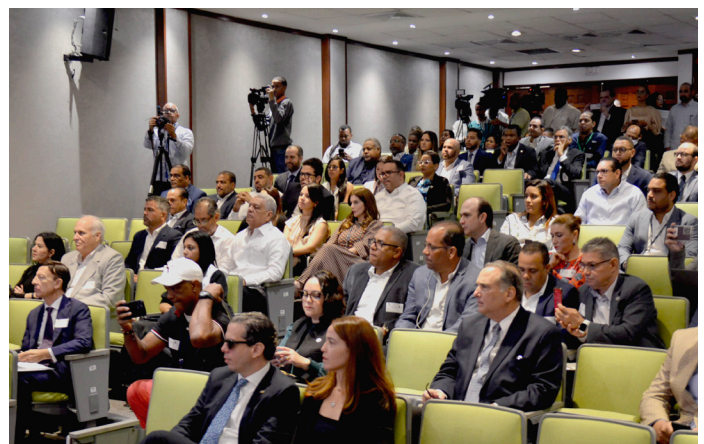
Asistentes al lanzamiento de la licitación para la compra del nuevo software de Aduanas.