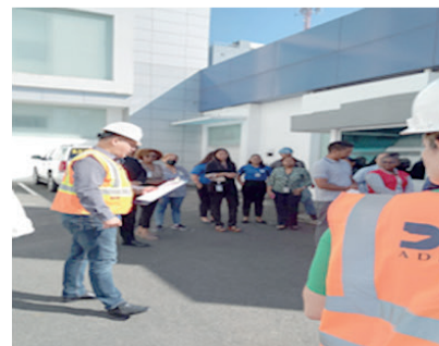
Edificio Lope de Vega