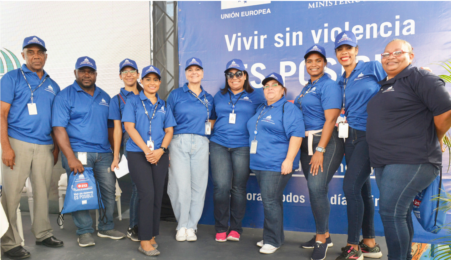
Varios de los colaboradores de la DGA participaron en el lanzamiento de “Vivir sin Violencia, es Posible”.