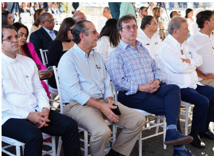
Parte de los asistentes al lanzamiento de las operaciones de cargas áreas y envíos expreso en el Aeropuerto del Cibao.

cumplir con el objetivo de posicionar al país como un hub logístico regional de clase mundial. “Cualquier inversión que se haga en logística, será de gran beneficio”, dijo Sanz Lovatón mientras aseguró que este es un paso más, de muchos.