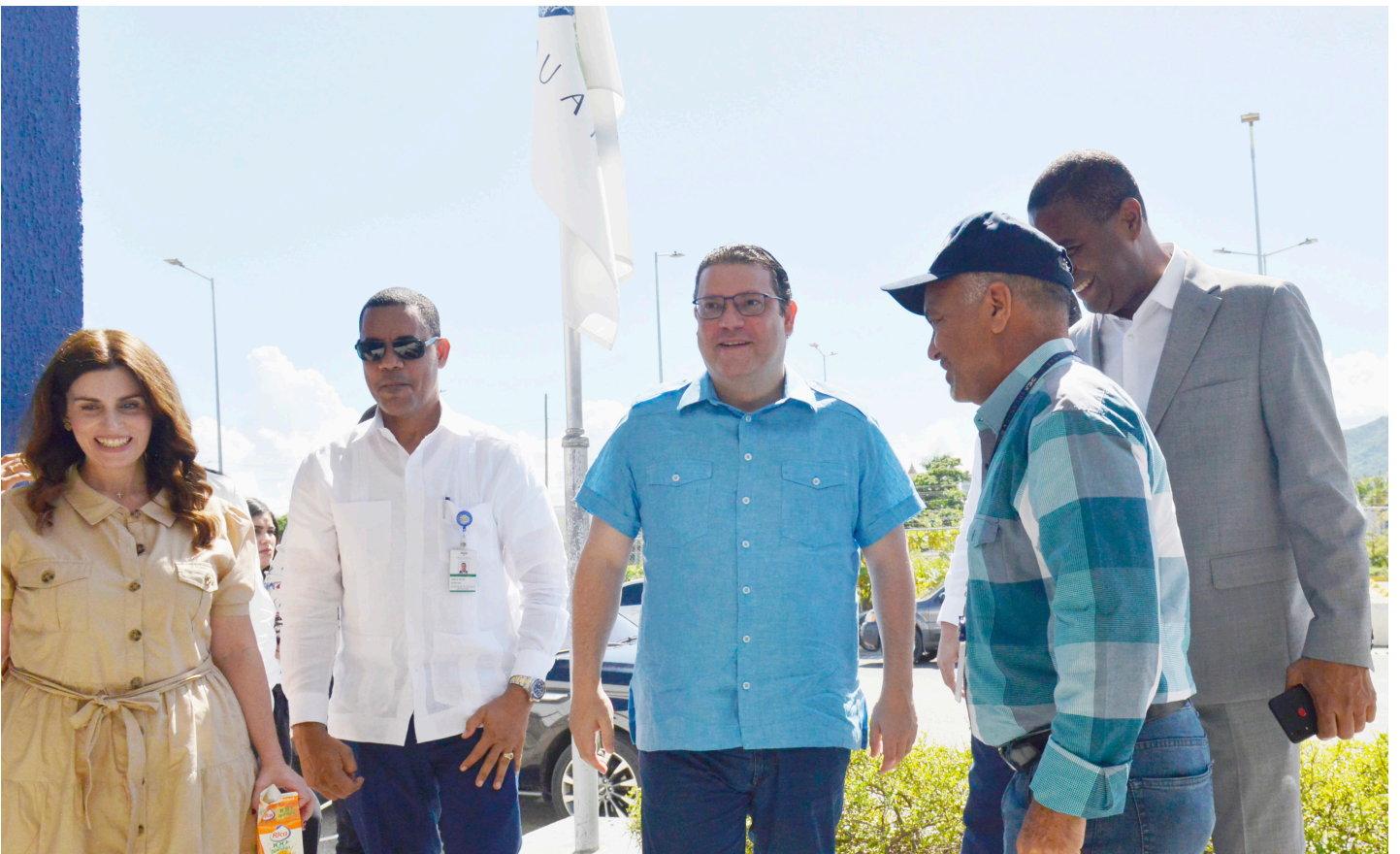
Por varias horas fue recorrida la Administración de la DGA en Puerto Plata para ver su desarrollo en esa zona.