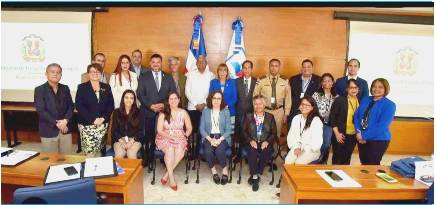
Los participantes que estuvieron en la actividad en donde se reafirmó el compromiso por la paz y seguridad internacional.