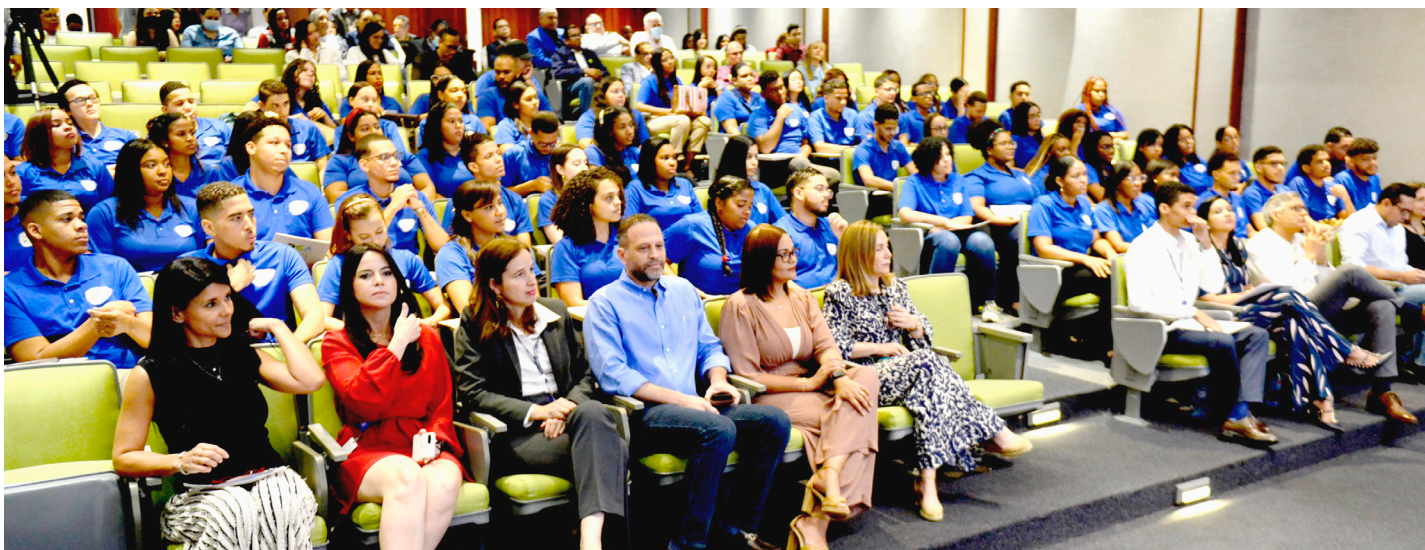
Parte de los ejecutivos de Aduanas en apoyo al interesante programa de "Pasantías DGA".

"Para ustedes, hoy, comienza otro ciclo; quédense con lo que aprendieron aquí, donde hicieron relaciones, amistades, adquirieron nuevos conocimientos y destrezas, pero sobre todo no se alejen de lo que vieron en la DGA", acotó Lovatón.