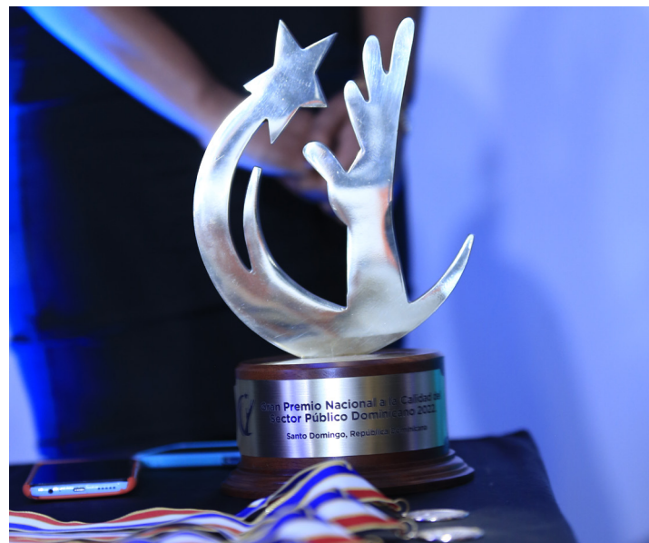
El trofeo del "Premio Nacional a la Calidad y el Reconocimiento a las Prácticas Promisorias del Sector Público".

Este premio es el resultado de una intensa labor que se inició con la aplicación de la autoevaluación del Marco Común de Evaluación (CAF, por sus siglas en inglés), el cual examina la organización desde distintos ángulos, con un enfoque holístico, y permite identificar las fortalezas y oportunidades de mejora con el objetivo de lograr una gestión de alta calidad para optimizar el servicio de todos los grupos de interés.