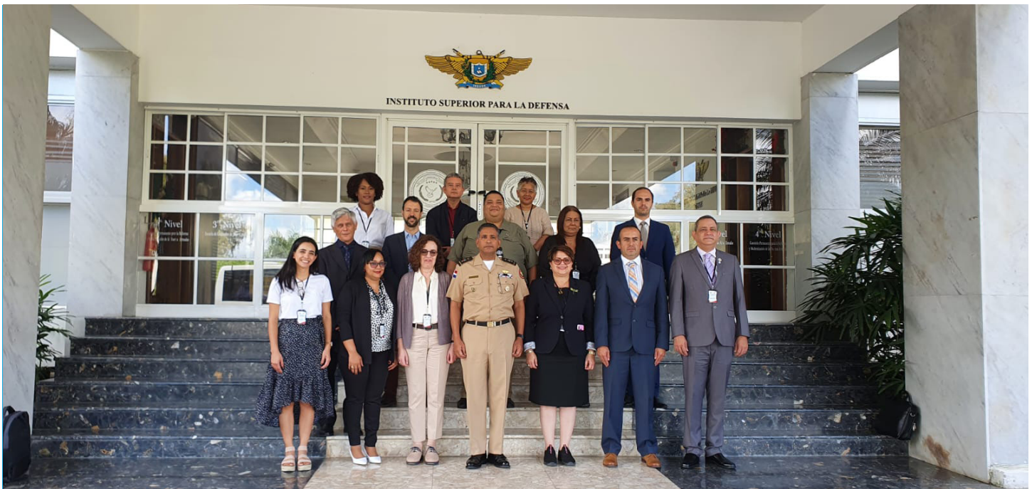
El equipo que estuvo realizando las conferencias y charlas posan, luego de terminada la jornada de trabajo.

si son suficientemente vinculantes con el mandato de la ONU, fortalecer los medios de supervisión y actores involucrados, habilitar un sistema de alerta temprana con el uso del Documento Único Aduanero (DUA) e implementar adecuadamente las listas operativas para detectar armas, vectores o sustancias de riesgo.