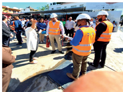
Coordinadora Zona Norte