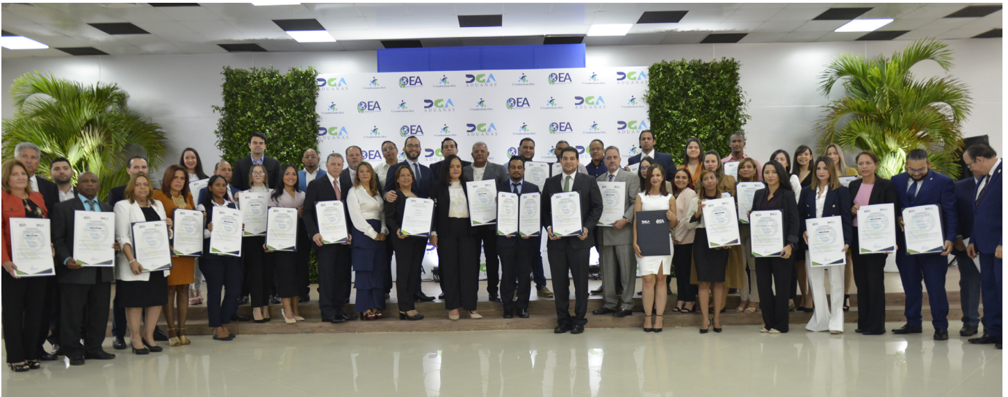
En el marco de la V Conferencia del Operador Económico Autorizado, unas 21 empresas recibieron su certificado que la acreditan como OEA.

que representan un avance para el comercio en el país, y aporta a la meta de convertir a República Dominicana en el Hub logístico de la región.