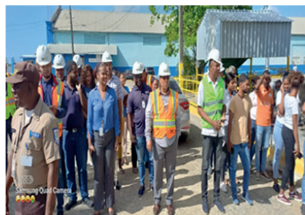
Muelle San Pedro de Macorís