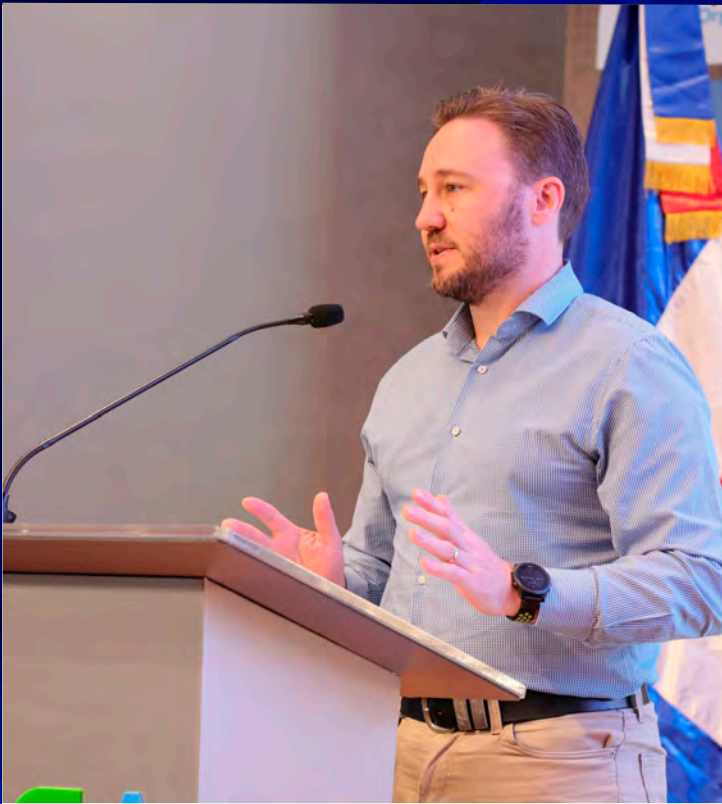
Benjamín Honey, consejero de la Fuerza Fronteriza Australiana.