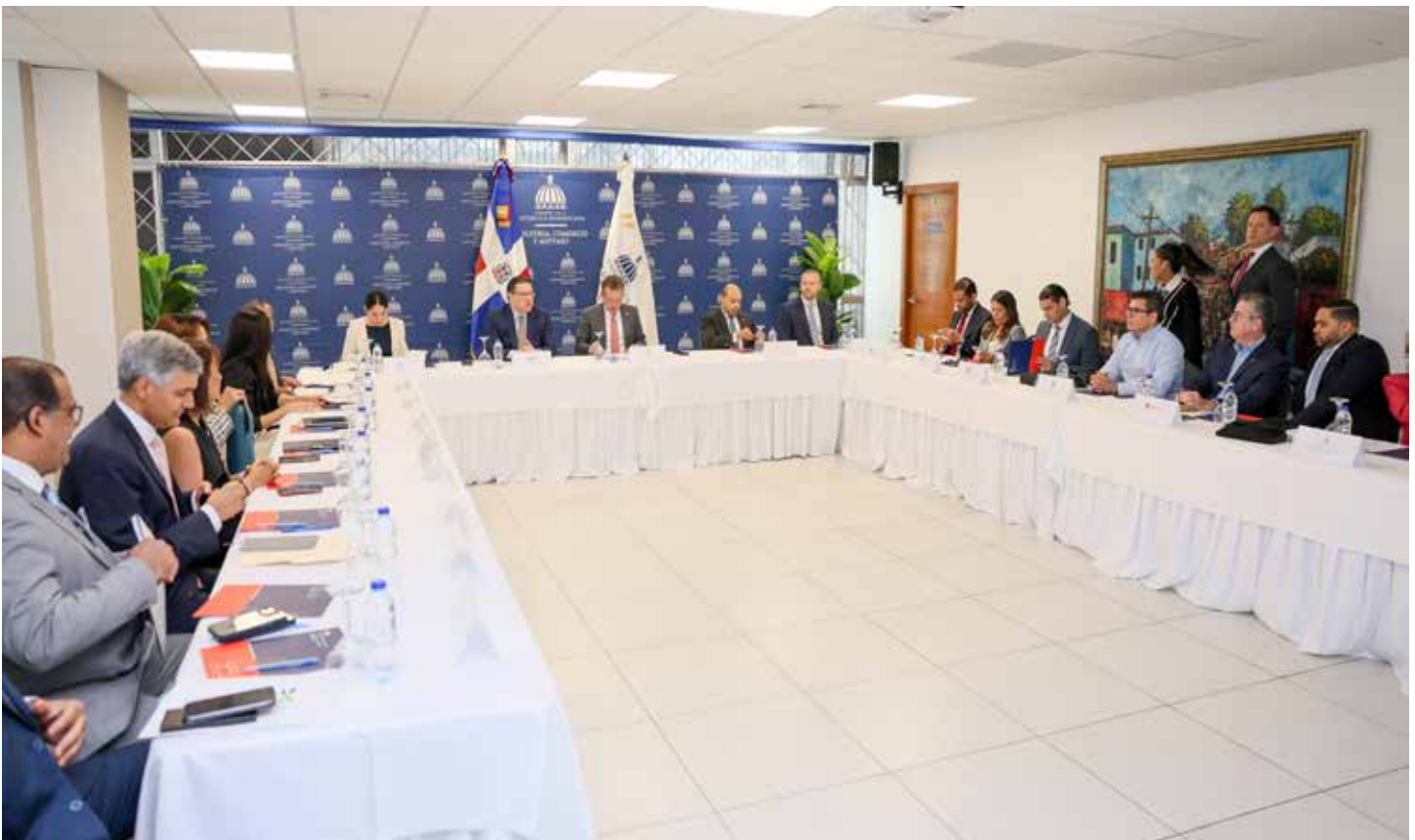
La primera reunión del Consejo Nacional de Logística (CNL) se realizó con la presencia de importantes representantes de los sectores público y privado.