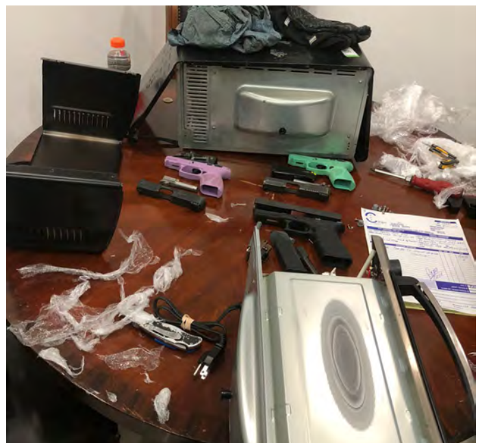
Parte de las armas que fueron decomisadas en los distintos hallazgos que se han producido a lo largo de estos años.