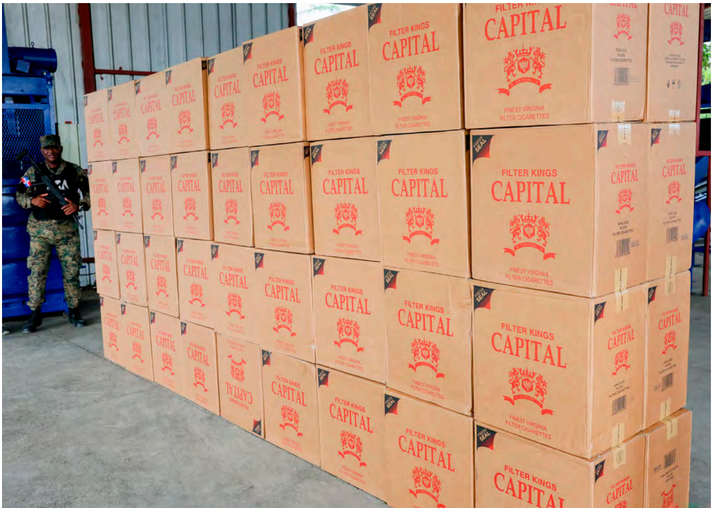
Parte de los cigarrillos que fueron incautados en frontera, puertos y aeropuertos.