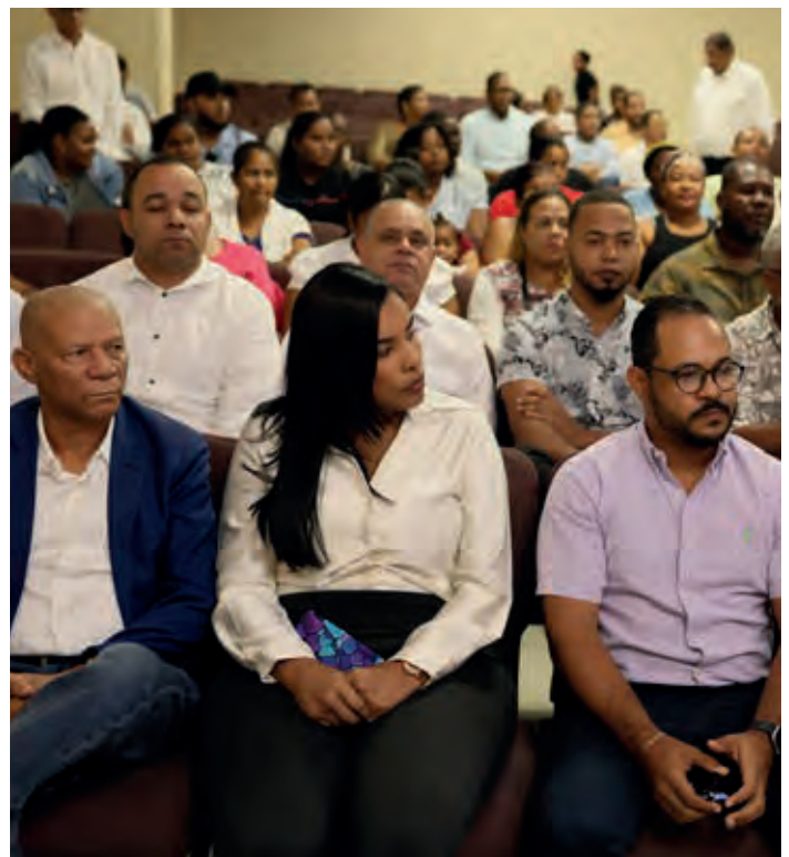
Parte de los asistentes al encuentro realizado en San Pedro de Macorís y en donde se habló del Hub logístico.