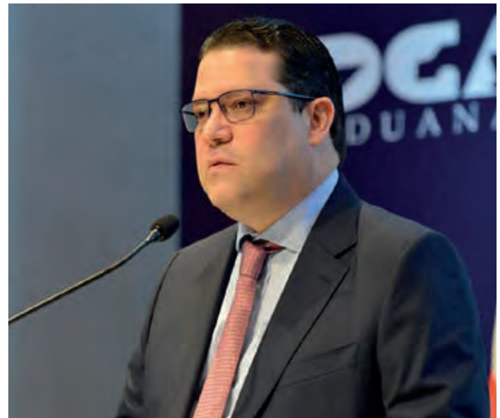
Yayo Sanz Lovatón, director general de Aduanas

En tanto que las exportaciones hacia Haití registraron un incremento de 30.3 %, al alcanzar los US$83.3 millones en febrero, lo que evidencia el fortalecimiento comercial con la región y de la relación con Haití.