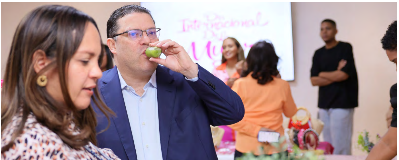
Durante esta actividad se realizó una feria de mujeres emprendedoras en la que el director pasó por las mesas donde se exhibía la mercancía y probó los productos comestibles.