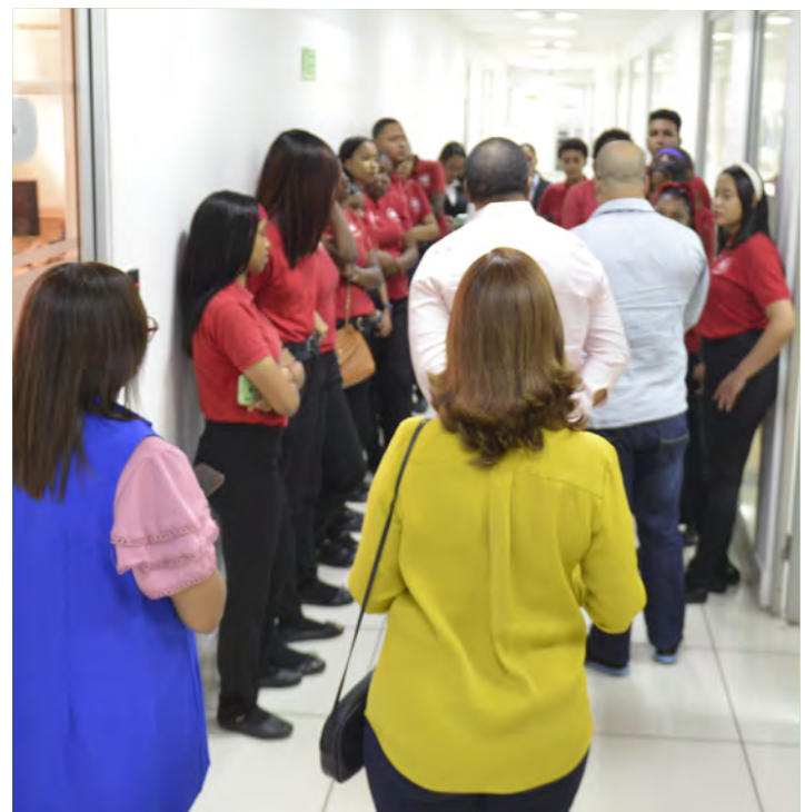
Estudiantes prestan atención a los técnicos de la institución mientras le dan el recorrido.

la educación integral de los jóvenes, ampliando sus horizontes y fortaleciendo su preparación para el futuro profesional.