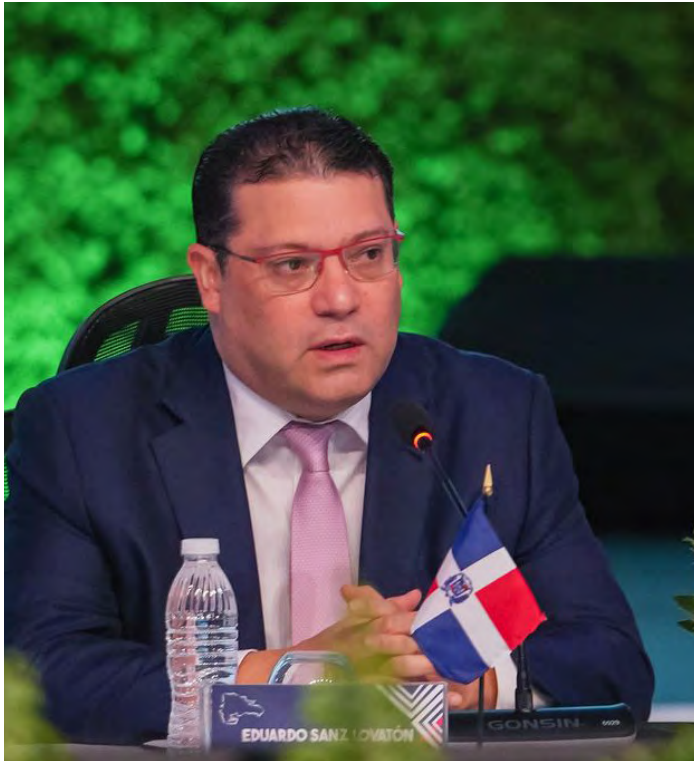
Durante la gestión de Eduardo Sanz Lovatón, en Aduanas se han realizados varios hallazgos importantes.

Se comprobó, ante los tribunales, la participación de ambos hombres en el tráfico internacional de armas, que operaba desde los Estados Unidos hacia la República Dominicana, un caso en el que participó el Departamento de Seguridad Nacional de los Estados Unidos (HSI, por sus siglas en Inglés), así como con otros organismos de investigación del Estado. Esto, tras un hallazgo en el muelle de Puerto Plata, en un contenedor consignado a la compañía Edi Cargo Express, procedente de Georgia, Estados Unidos.