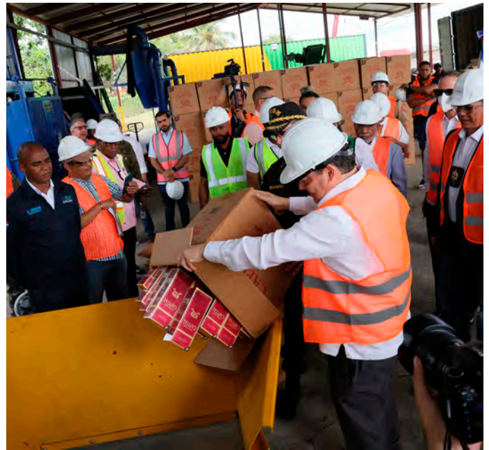
El director de Aduanas procede a la incineración de los cigarrillos.

El acto de destrucción se realizó en las instalaciones de la empresa recicladora Resicla.