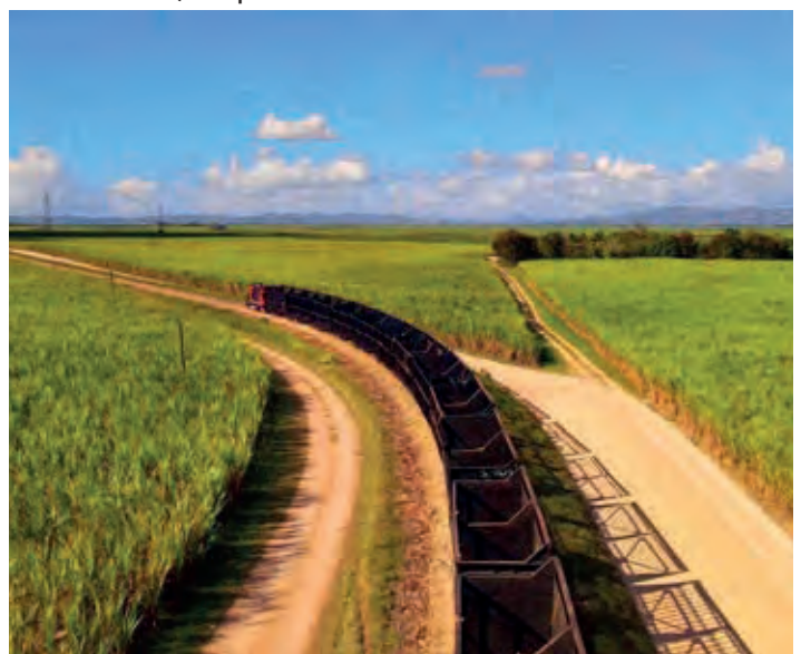
El Central Romana es una empresa Agro-industrial y Turística arraigada en República Dominicana.

“A través de sus organismos aduaneros los gobiernos de la República Dominicana y de los Estados Unidos intercambian información que optimiza la detección de peligros para ambas naciones”, expresó.