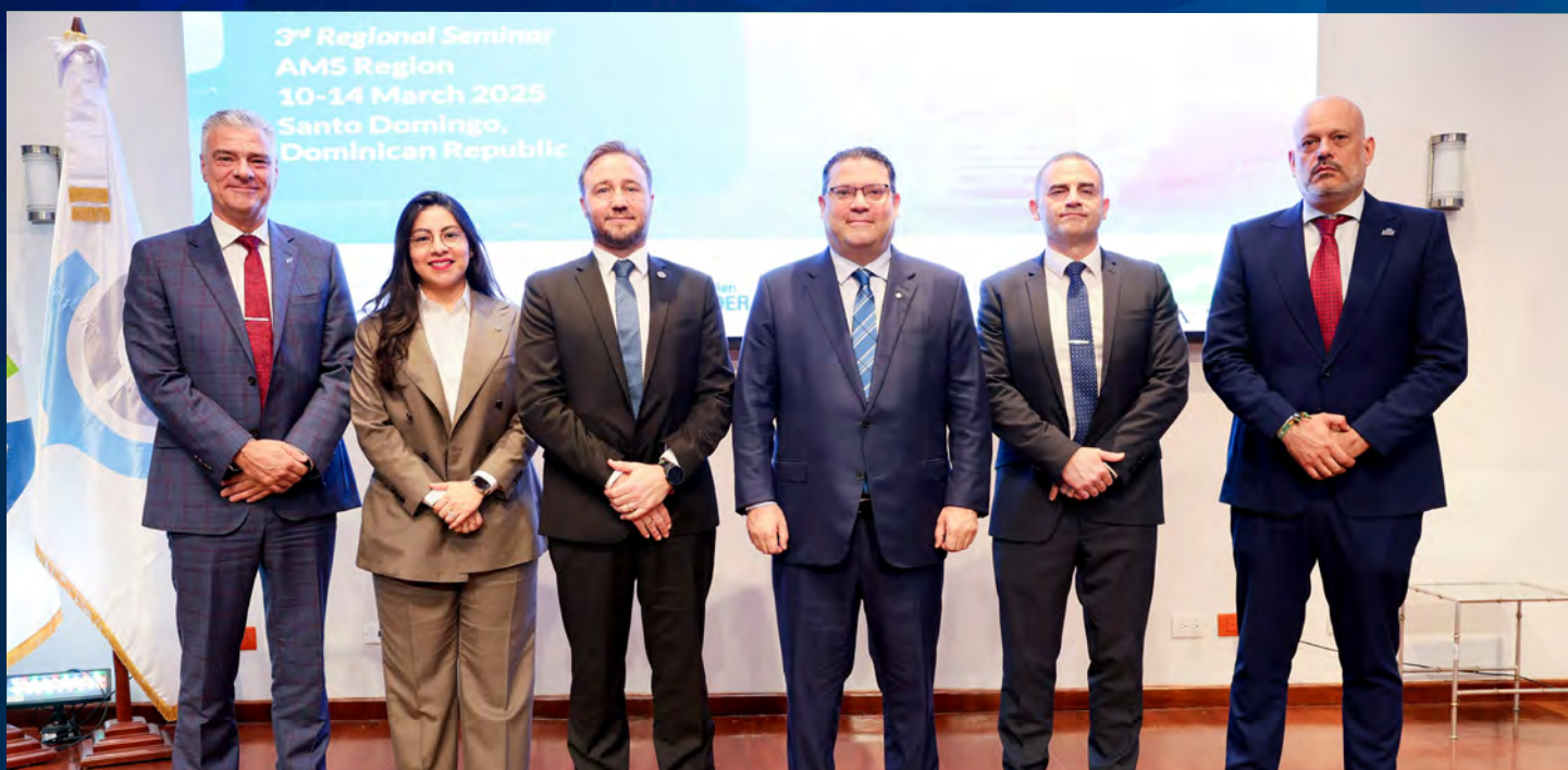
Altos funcionarios de la OMA que participan en el seminario.