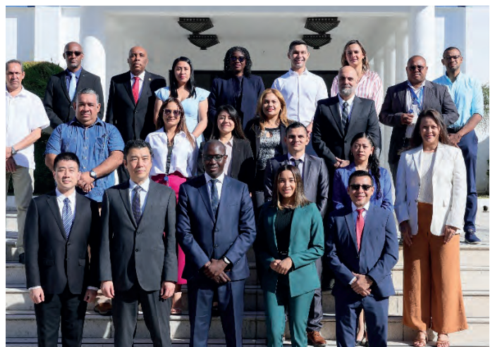
Capacitadores y representantes de los organizadores del programa junto a los participantes durante el primer día de la capacitación.