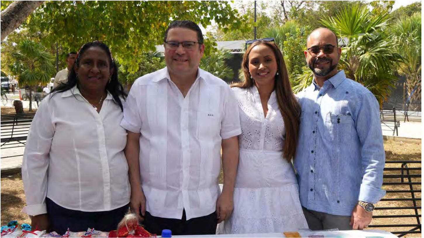
Durante su visita a Montecristi, el director general de Aduanas intercambió ideas con comerciantes, empresarios y funcionarios de distintas entidades.