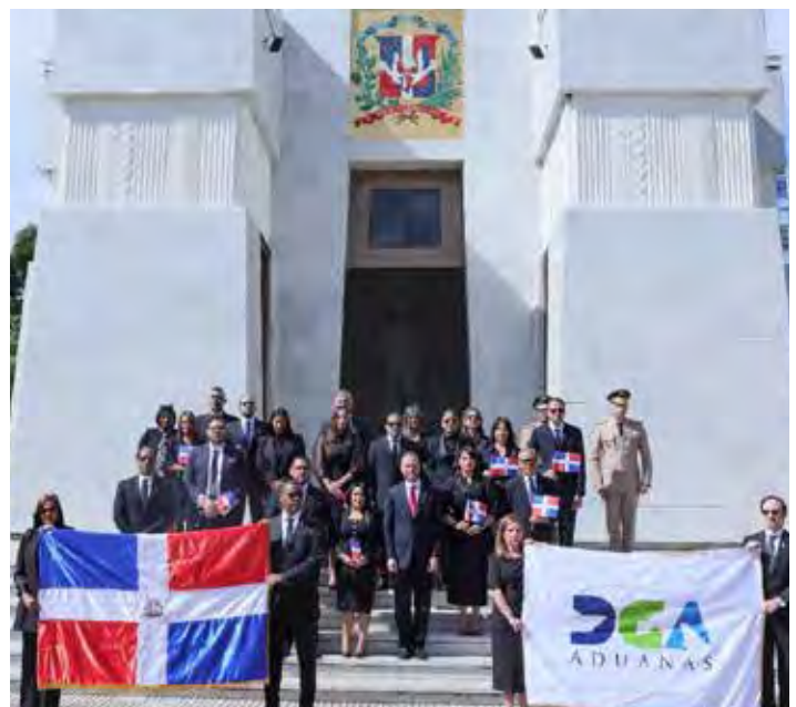
Parte de los ejecutivos de Aduanas que estuvieron en el acto de entrega de una ofrenda floral en el Altar de la Patria.

La Dirección General de Aduanas invita a toda la ciudadanía a unirse en la celebración del mes de la patria y a recordar con gratitud y respeto a los valientes hombres y mujeres que hicieron posible la República Dominicana que hoy conocemos.