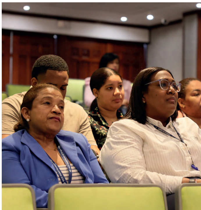
Los presentes escuchaban con atención la charla “Un regalo de amor” y reflexionaban al respecto.

con Dios y reconocer que somos pecadores, el deseo es celebrar el amor de Dios todos los días de nuestras vidas, hasta que vayamos al reino o esperar que Cristo Venga”.