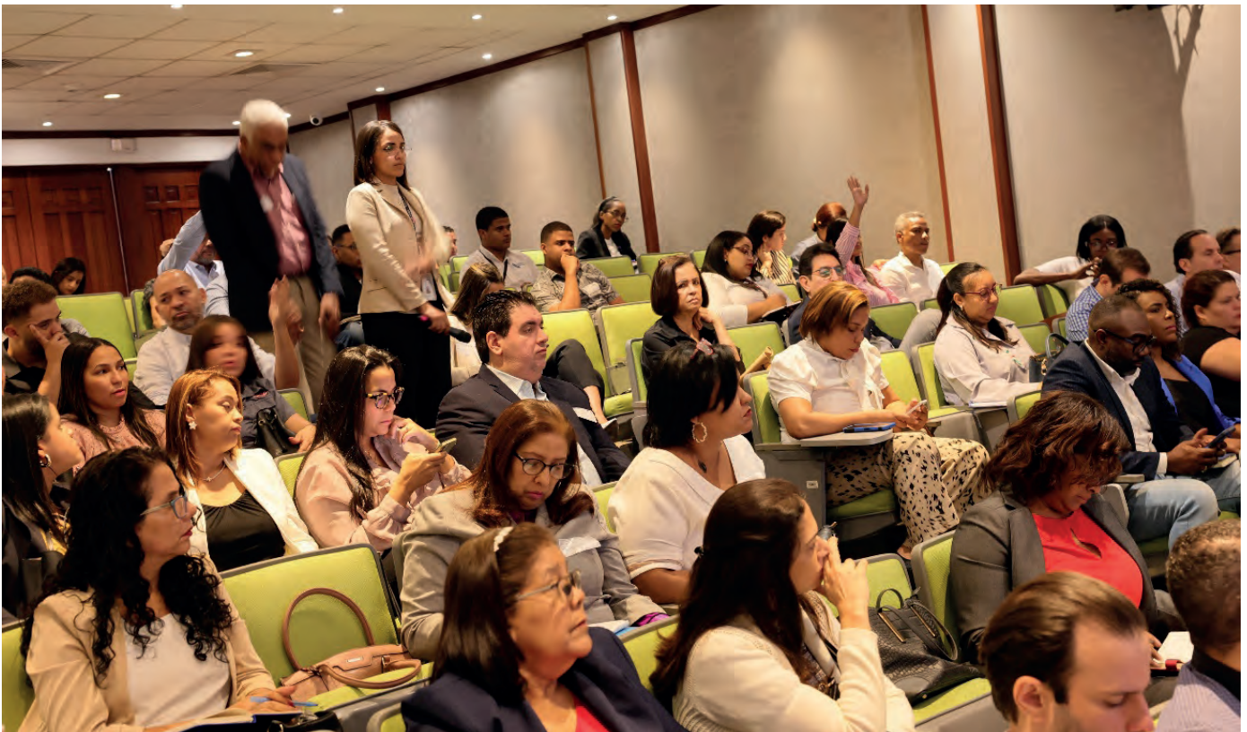
Los participantes realizaron sus preguntas e inquietud referente a la regulación y requisitos de productos industrializado, el cual fueron respondida.