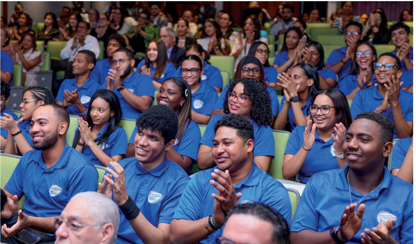
Los pasantes con gran alegría, entusiasmo y gran expectativa participaron en este acto de cierre, luego del proceso de aprendizaje recibido en cada área.

“Piensen qué quieren ser en la vida, donde puedan desarrollar su mayor talento, enfocados en la excelencia y mejor versión, nunca perder la visión de la fuerza que tiene el servicio y hacer siempre lo correcto, incluso cuando nadie nos está mirando”, resaltó el subdirector.