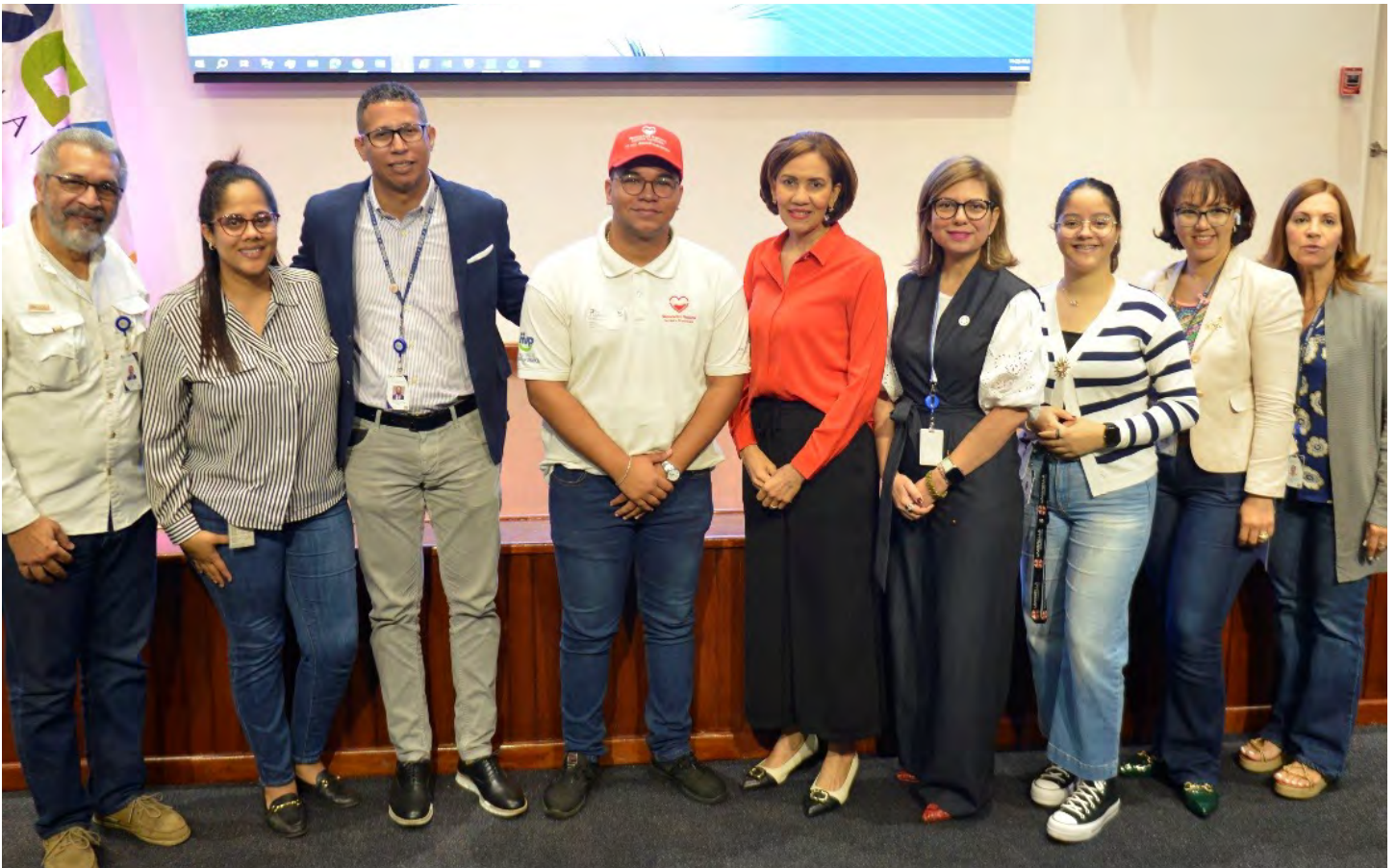
Ejecutivos y colaboradores de la DGA estuvieron presentes en la charla “Dona sangre, dona vida”, para fomentar que las personas donen sangre y así se puedan salvar vidas.