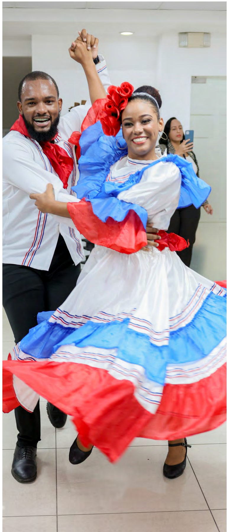
Un grupo de baile, donde la música típica estuvo presente, llegó a la DGA animando la celebración de ese día.

Este evento histórico sigue siendo un pilar fundamental de la identidad