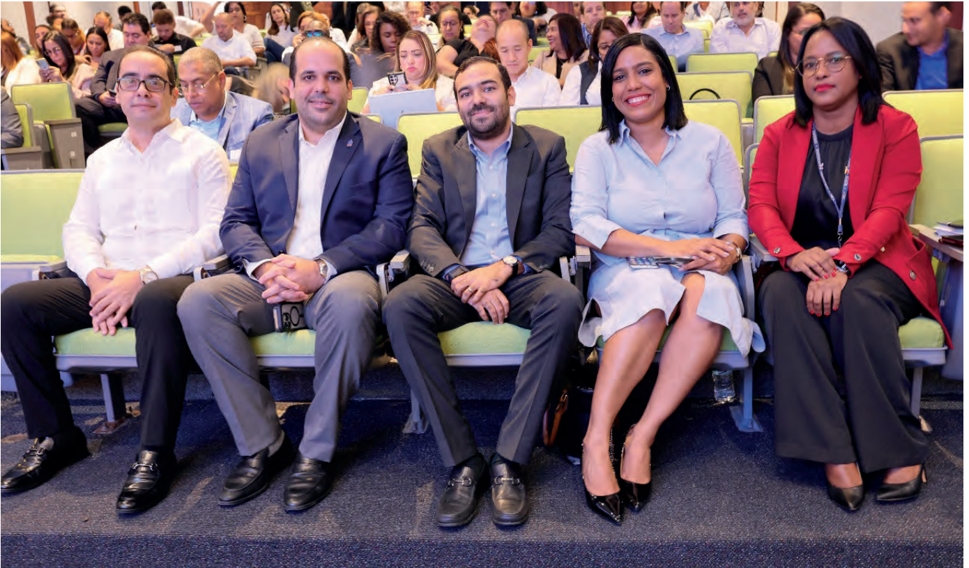
Autoridades DIGEMAP, Ventanilla Única de Comercio Exterior (VUCE), entre otros encargado de áreas, apoyaron el encuentro.