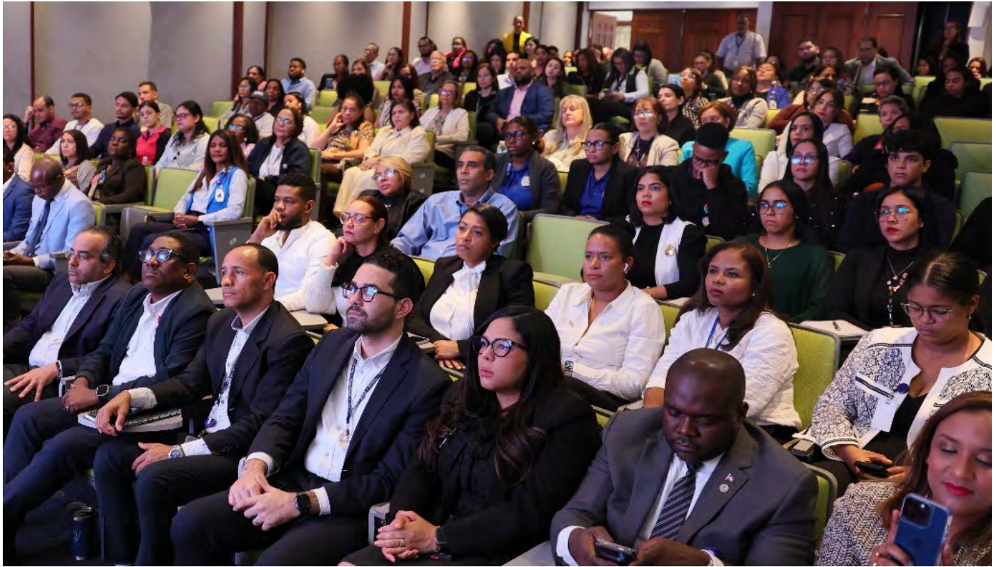
Los participantes estuvieron atentos a la capacitación, Raíces Invisibles “La Corrupción que nace en casa”.

Las consecuencias de estas conductas incluyen la normalización de comportamientos corruptos, el impacto en la integridad personal y profesional, la reproducción intergeneracional de la corrupción, dificultades en la adaptación a entornos éticos y la contribución al deterioro social.