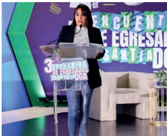
Lucía Zorrilla, subdirectora general de Aduanas, tuvo a su cargo las palabras centrales del encuentro de Pasantía.

“La DGA es clave para el desarrollo económico de nuestro país, desempeñando un papel fundamental en el comercio internacional, por eso estamos convencidos que el sector logístico es la gran apuesta de nuestra nación para garantizar prosperidad en el futuro inmediato”, puntualizó Zorrilla.