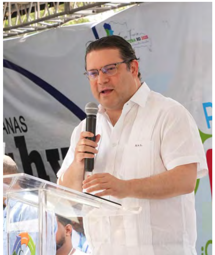
Expo Feria ProFrontera RD 2025 fue un evento organizado por el Consejo de Coordinación de la Zona Especial de Desarrollo Fronterizo (CCDF), y estuvo dedicado al presidente de la República, Luis Abinader Corona.