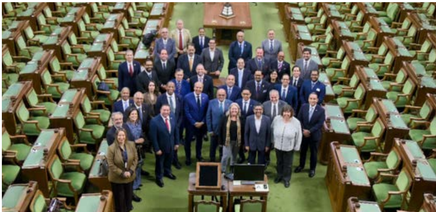
Durante el evento se realizaron varios foros, paneles y seminarios en los que la institución participó activamente.