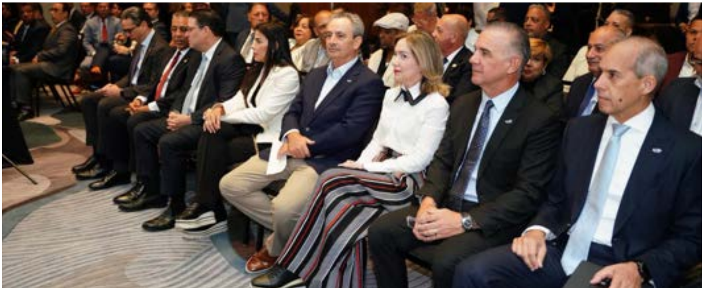
Parte del público que asistió a la conferencia "Hecho en RD, Consumido en EE. UU.: La Nueva Ruta Comercial".