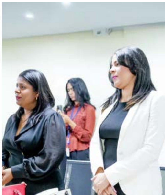
Funcionarios de la Dirección de Compras y Contrataciones estuvieron presentes.

El acuerdo se enmarca dentro de las políticas de gestión administrativa y de fortalecimiento institucional impulsadas por el Poder Ejecutivo, alineadas con las metas de recaudación, eficiencia y transparencia del Estado dominicano.