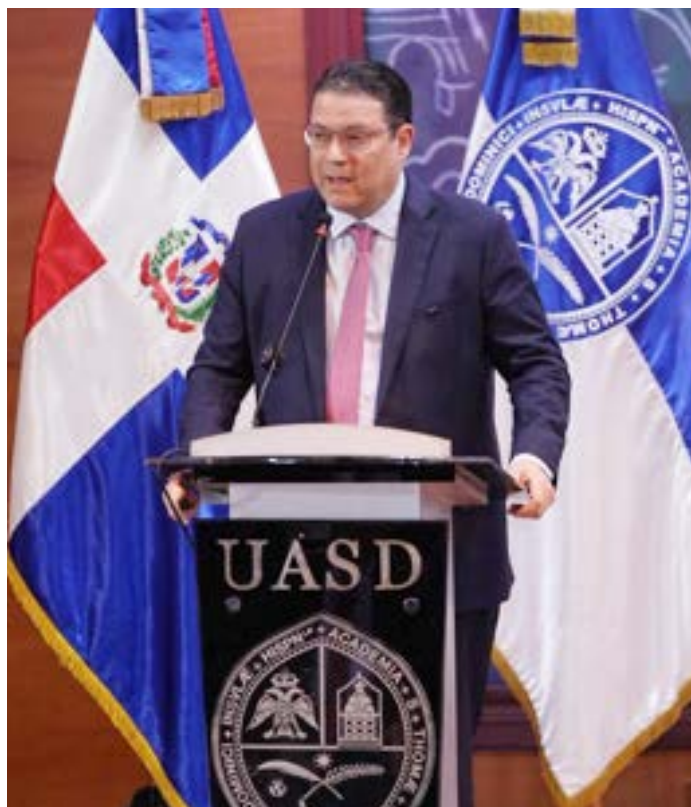
El director general de Aduanas, Yayo Sanz Lovatón, explicó que esa institución recaudó un promedio de 22.64 % de los ingresos entre 2021 y 2024 y el 3.4 % del Producto Interno Bruto (PIB) en el 2024.

La actividad forma parte del programa académico conmemorativo que celebra la UASD por su 487.º aniversario.