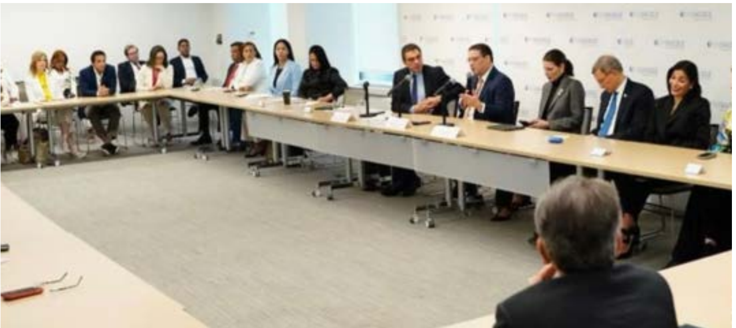
Representantes del sector privado, junto al director de la DGA en el diálogo de la Semana Dominicana en Washington.

El Diálogo es una organización hemisférica que construye redes de cooperación y acción para promover la resiliencia democrática, la prosperidad compartida, la inclusión social y el desarrollo sostenible en las Américas. Influye en los debates políticos, idean soluciones y potencian la colaboración para impulsar cambios significativos en el hemisferio occidental.