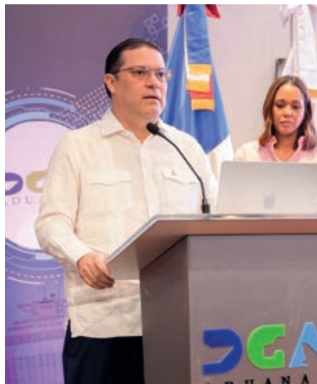
El director de la DGA, valoró positivamente la participación de los colaboradores.

El propósito de este panel fue claro y preciso, abordado desde una mirada integral, porque sabemos que esta enfermedad no se enfrenta solo con medicina, sino, también, con apoyo, conciencia, redes de cuidado y políticas que protejan.