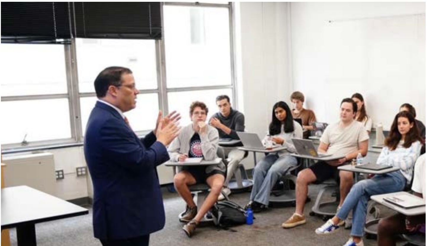
Director de Aduanas ofreciendo la posición de República Dominicana como hub logístico en Washington.

El Diálogo es una organización hemisférica que construye redes de cooperación y acción para promover la resiliencia democrática, la prosperidad compartida, la inclusión social y el desarrollo sostenible en las Américas. Influye en los debates políticos, idean soluciones y potencian la colaboración para impulsar cambios significativos en el hemisferio occidental.