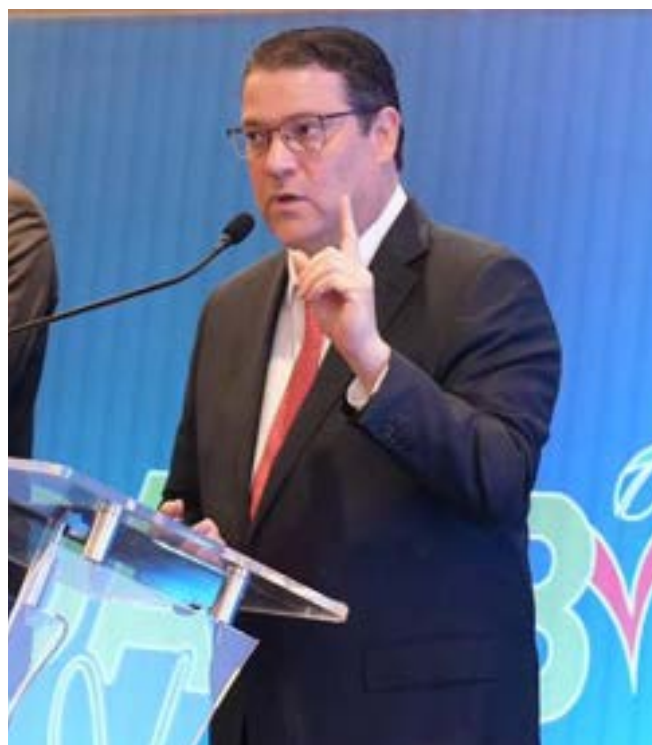
El director general de Aduanas, Yayo Sanz Lovatón, destacó el crecimiento comercial de Dajabón y el fortalecimiento de sus controles fronterizos.

Resaltó, además, que el intercambio total con Haití a septiembre de 2025 ascendió a US$882.69 millones, para un crecimiento del 30.2 % en comparación a los US$677.88 millones intercambiados en igual periodo de 2024.