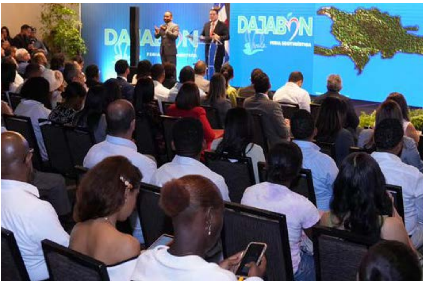
Durante el acto, los presentes, quedaron impresionados por las estadísticas de exportación en Dajabón y los avances logrados bajo la gestión del director de Aduanas.