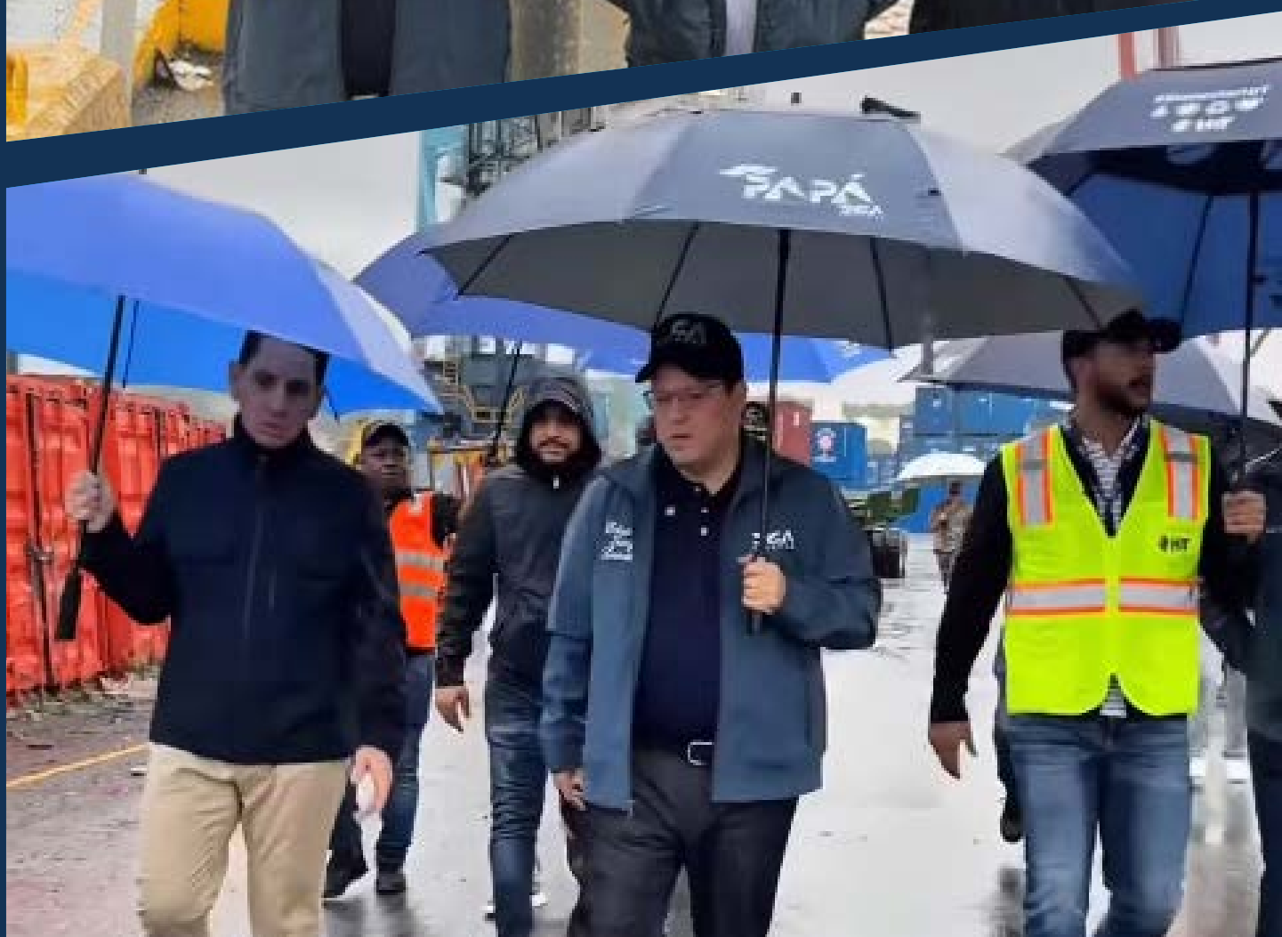
El director general de Aduanas, Yayo Sanz Lovatón y ejecutivos de la DGA lideran acciones operativas junto al equipo del puerto de Haina para garantizar la continuidad institucional.