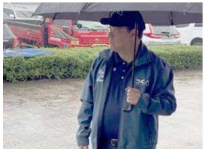
Yayo Sanz Lovatón, director general de Aduanas, garantizó un monitoreo ciudadano durante la suspensión de operaciones por la tormenta Melissa.

Estas acciones forman parte del compromiso institucional de la DGA con la seguridad, la eficiencia y la resiliencia del comercio exterior dominicano, asegurando que, incluso ante fenómenos atmosféricos, el comercio no se detiene.