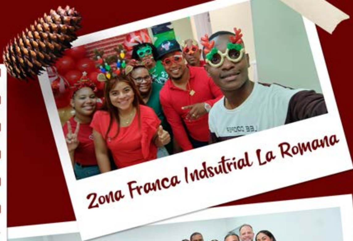
Zona Franca Industrial La Romana