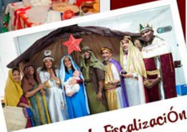
Gerencia de Fiscalización