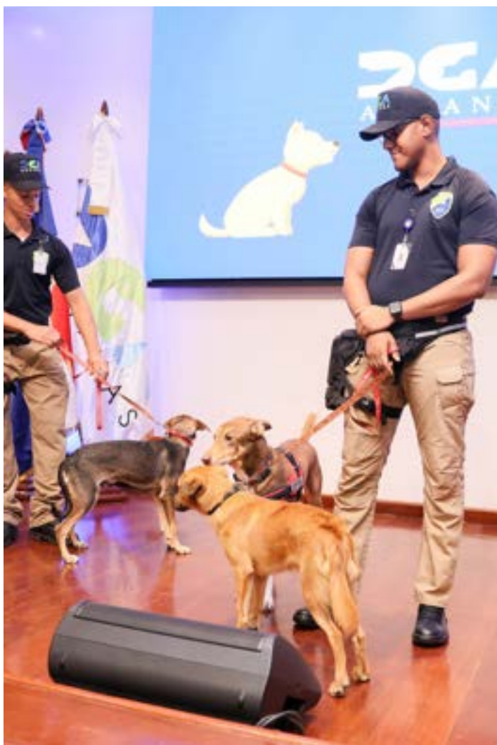
Parte del equipo, Unidad Canina, presentaron algunas de las mascotas en la actividad.