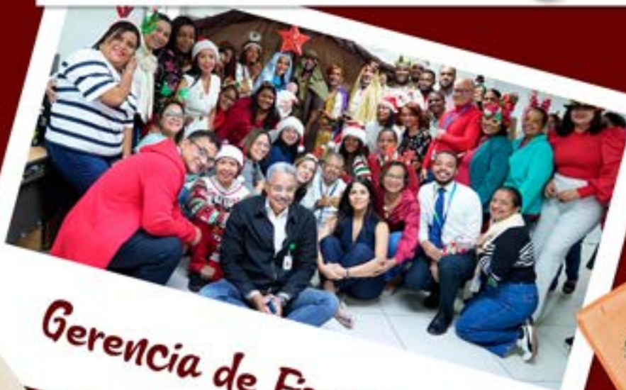
Gerencia de Fiscalización