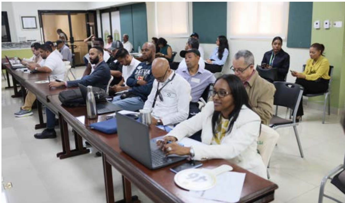
Participantes durante la subasta pública de mercancías decomisadas realizada por la Dirección General de Aduanas (DGA) en la Bolsa Agroempresarial de la República Dominicana.