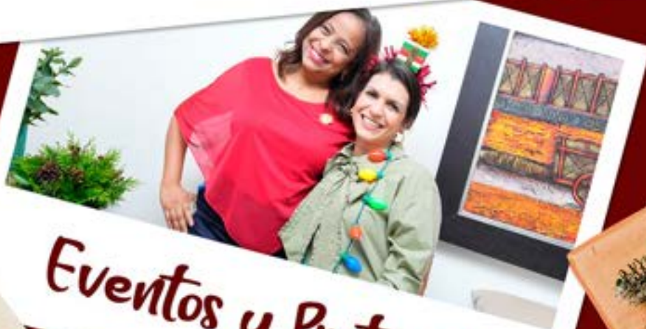
Eventos y Protocolo