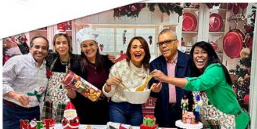
Gerencia de Fiscalización