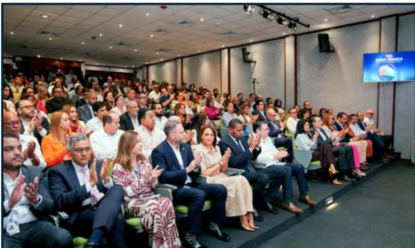
Parte de los asistentes a la actividad.