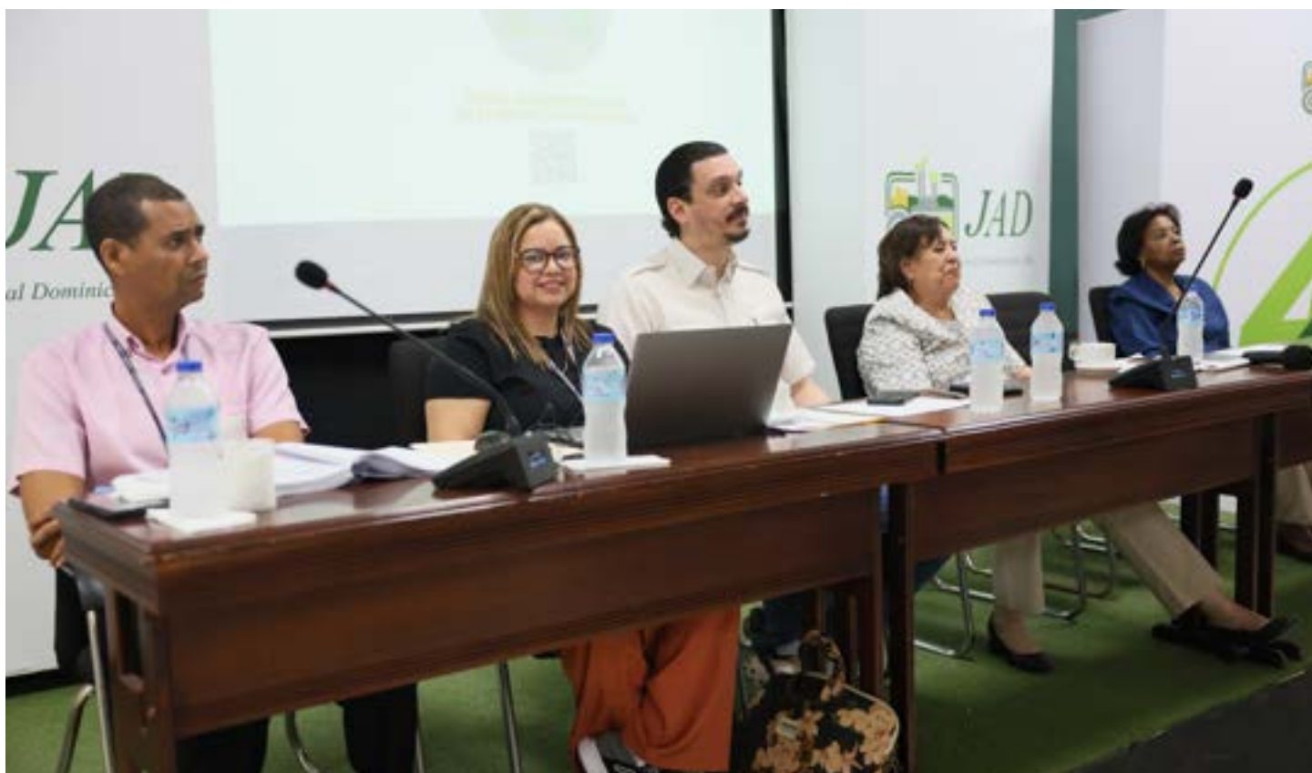
Autoridades que encabezaron la subasta pública realizada por la Dirección General de Aduanas (DGA).