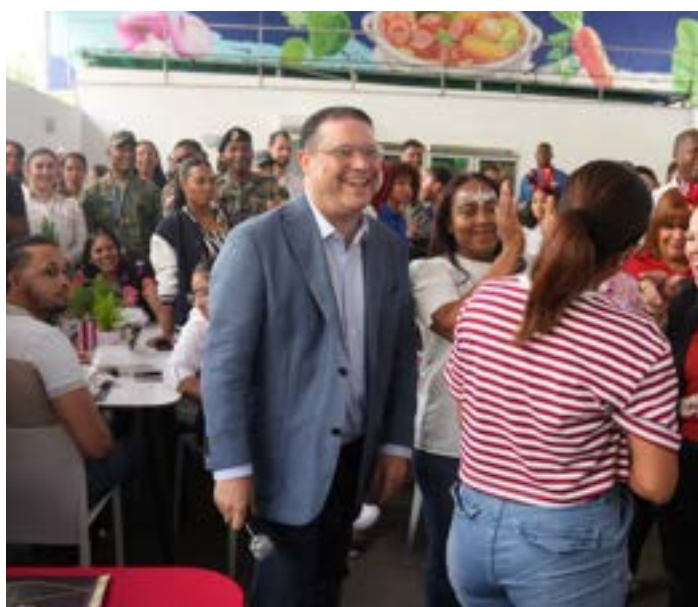
El director general de la DGA comparte con los colaboradores en el agasajo de Navidad.

Este encuentro reafirma el compromiso de la DGA con la integración y el bienestar de su personal, promoviendo la camaradería y el espíritu navideño. La institución extiende sus mejores deseos en recibir Felices Fiestas y un próspero Año Nuevo a todos sus colaboradores y a la comunidad.