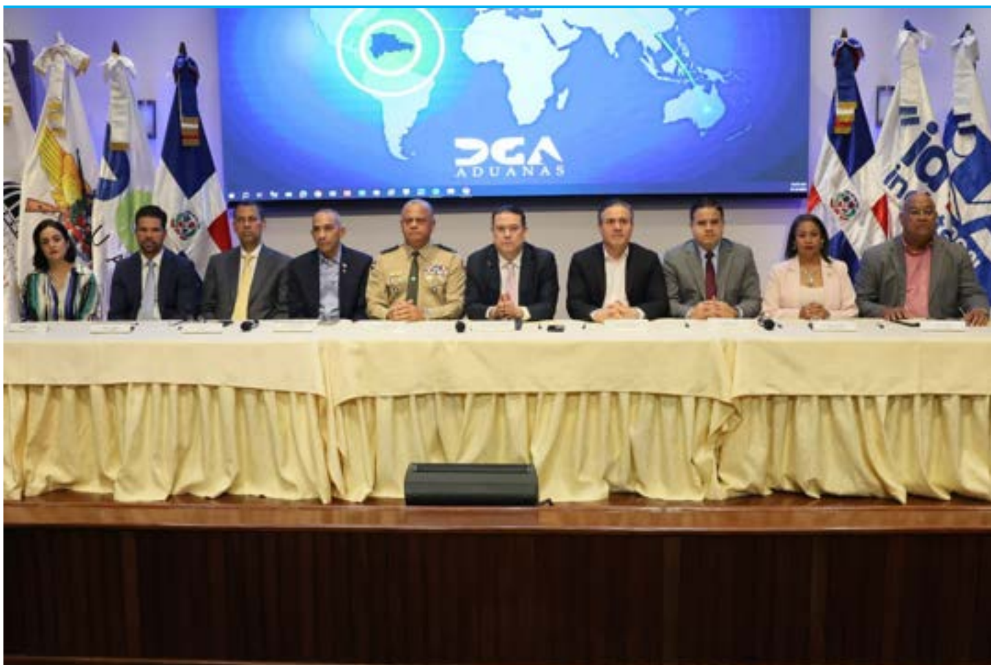
Representante de las diez instituciones estatales, que realizaron la firma de acuerdo en consolidación de las operaciones en VUCE.