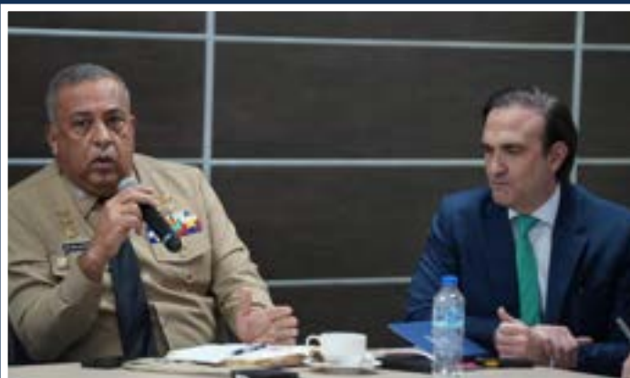
El vicealmirante Luis Rafael Lee Ballester y Rainiero Olivo Bordas, representante de la DGA.

Entre las acciones y medidas innovadoras que han sido implementadas están; la medición del riesgo valor durante los procesos de despacho, el uso de rayos X y bodycams , mesas de trabajo con otras aduanas internacionales sobre mejores prácticas de control con importadores asiáticos, fiscalizaciones conjuntas con DGII y la clausura de empresas involucradas en prácticas ilícitas. otras