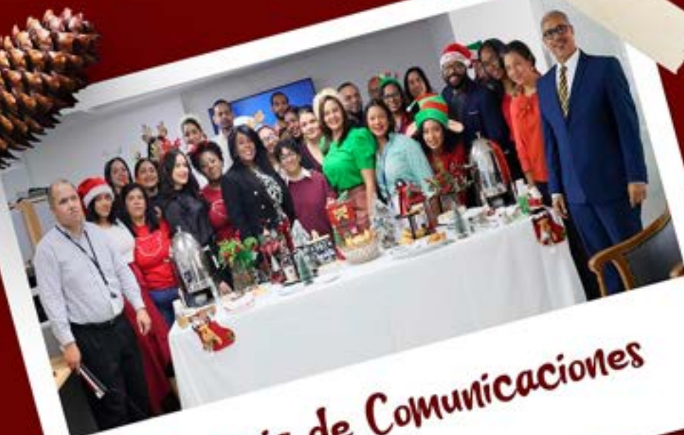
Gerencia de Comunicaciones