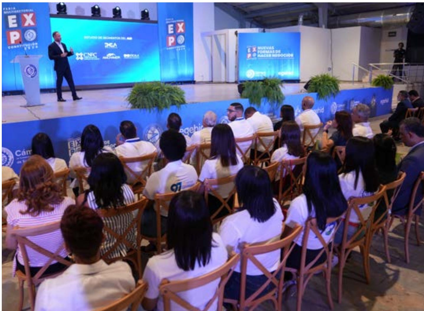
Comerciantes de San Cristóbal hicieron preguntas y felicitaron a la DGA por los logros obtenidos durante estos 5 años.

El evento organizado por la Cámara de Comercio y Producción de San Cristóbal, se realizó en el Politécnico Loyola, centro de pensamiento y formación clave para esa demarcación. Participaron alcaldes, legisladores y demás autoridades de la provincia.