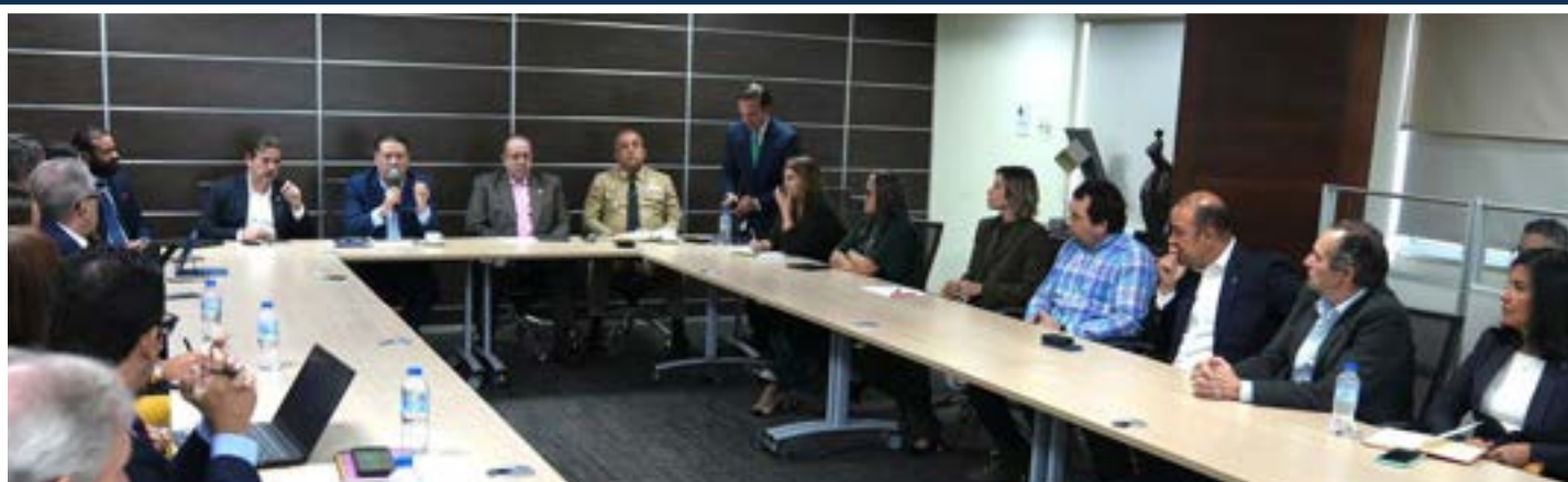
Parte de los asistentes a la actividad de la Mesa Contra la Competencia Desleal y el Comercio Ilícito.